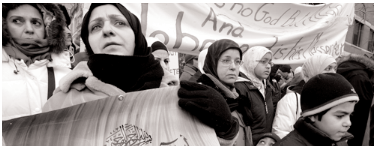
Manifestants pour la paix au Liban

Professeur, Département de sociologie, Université du Québec à Montréal