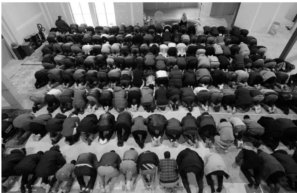
Mosquée de Montréal

Le 26 mai 2005, l'Assemblée nationale du Québec a adopté à l'unanimité une motion s'opposant à l'implantation des tribunaux dits islamiques au Québec et au Canada. Nous reproduisons ici les textes des discours prononcés alors par les députées Fatima Houda-Pepin (Parti libéral du Québec), Jocelyne Caron (Parti québécois) et Sylvie Roy (Action démocratique du Québec).