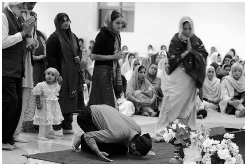
L'islam est devenu la première religion non chrétienne au Québec.

des recensements. Il n'est pas dit non plus que les Chinois, les Vietnamiens et les Japonais qui se disent « bouddhistes » aient une pratique exclusive.